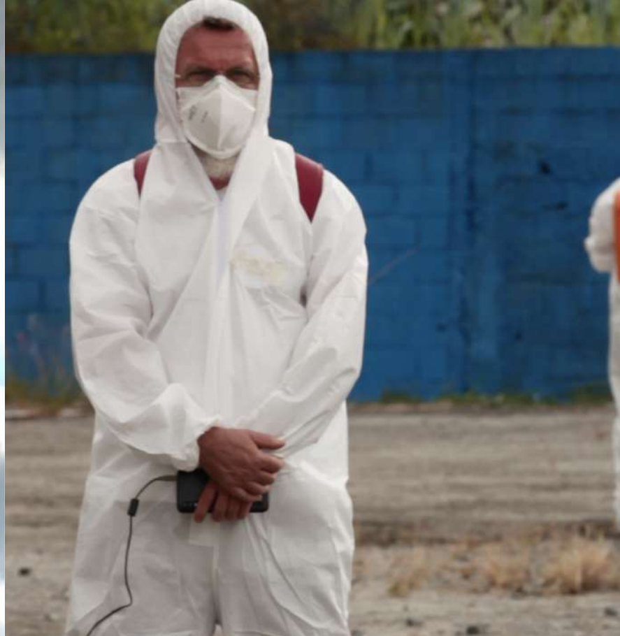
ILHA :: A vida é uma Utopia :: Mostra AVXLab 2021: lugar (in)comum :: São Paulo / Brasil 2021