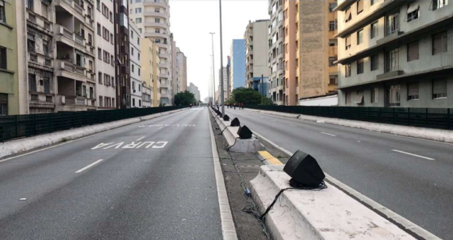
FlorestAR_devir floresta :: A Vida é uma Utopia :: Virada Sustentável :: São Paulo / Brasil 2020