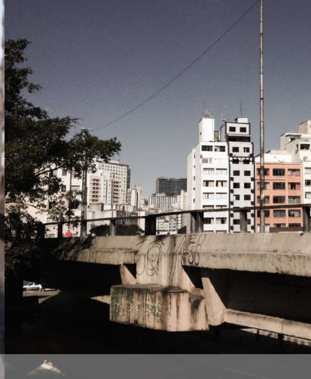
Promenade :: Minhocão :: Virada Cultural :: São Paulo / Brasil 2015