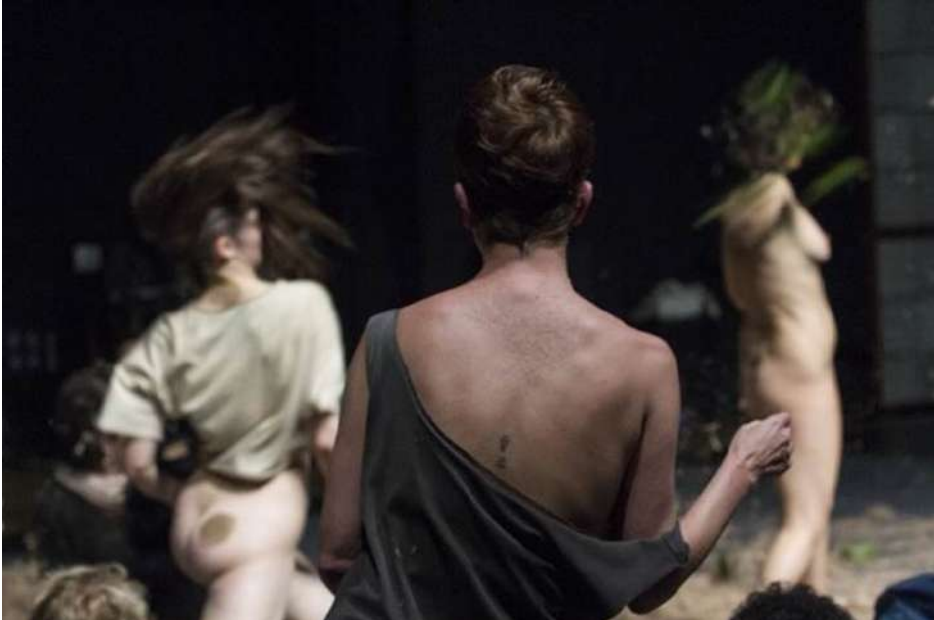
Música e Instalação sonora para o espetáculo Protesto :: Núcleo Artérias – Bienal SESC de Dança – Campinas - Brazil 2017