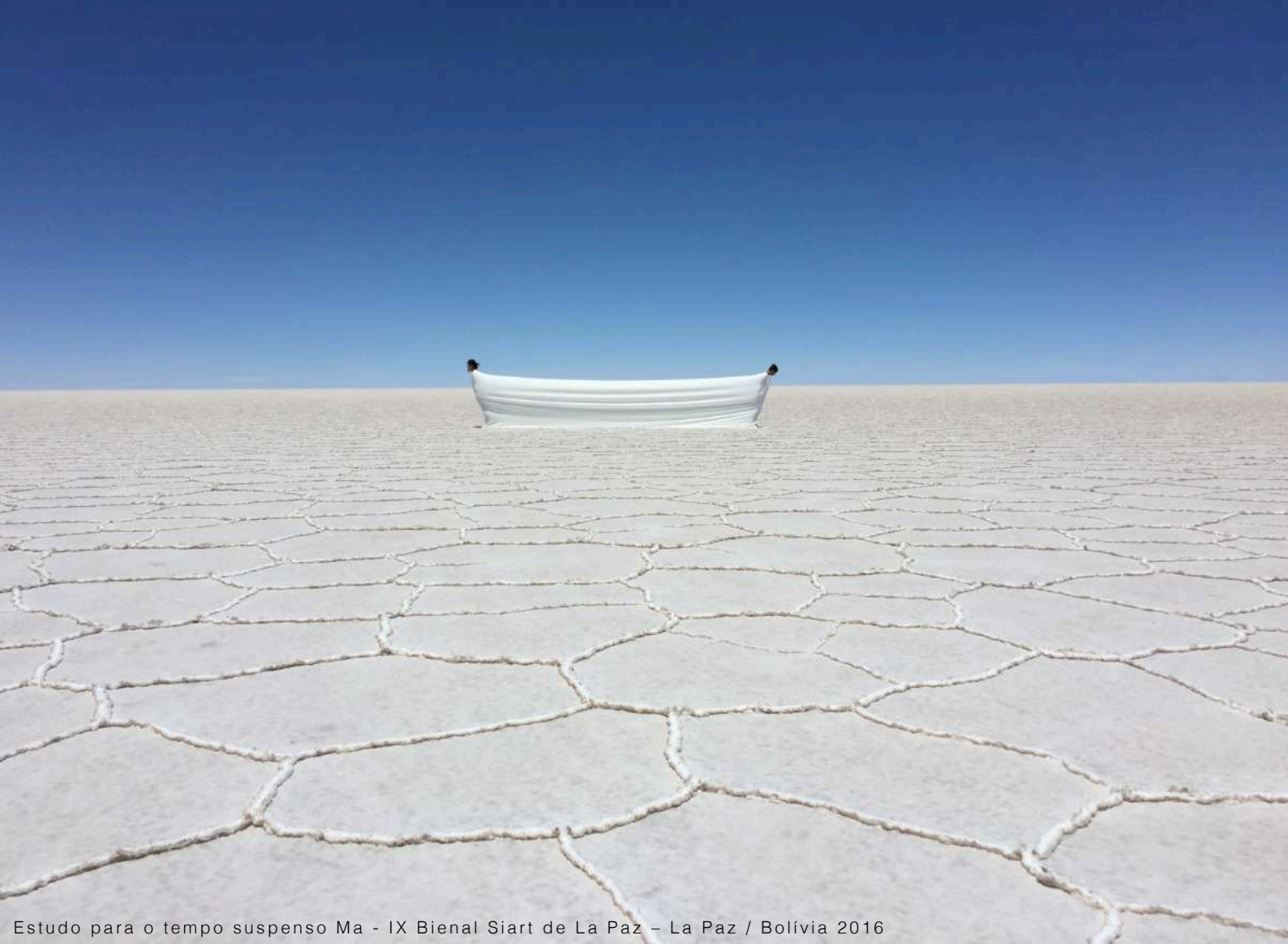
Estudo para o tempo suspenso Ma - IX Bienal Siart de La Paz – La Paz / Bolívia 2016